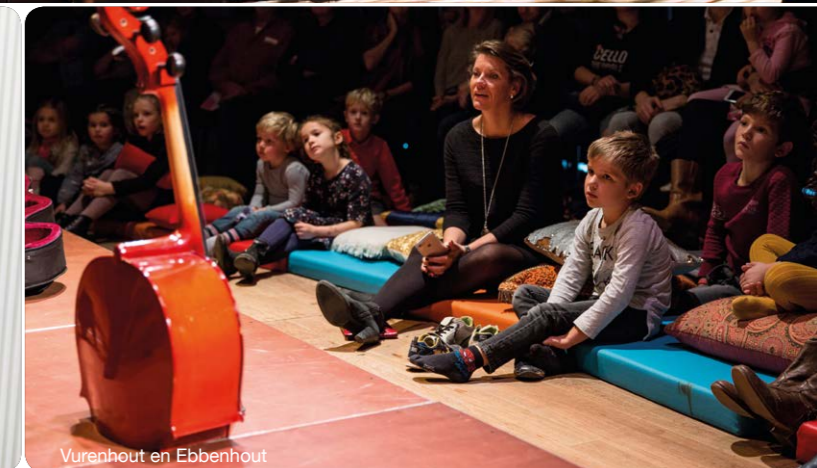
Vurenhout en Ebbenhout