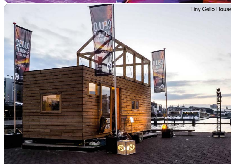
Tiny Cello House