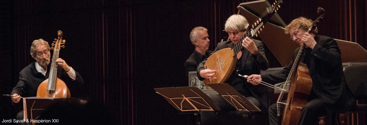
Jordi Savall & Hesperion XXI