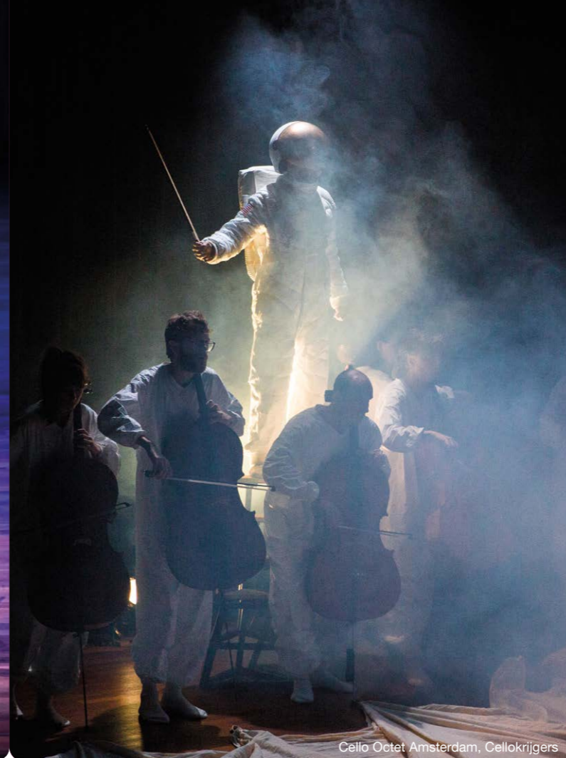
Cello Octet Amsterdam, Cellokrijgers