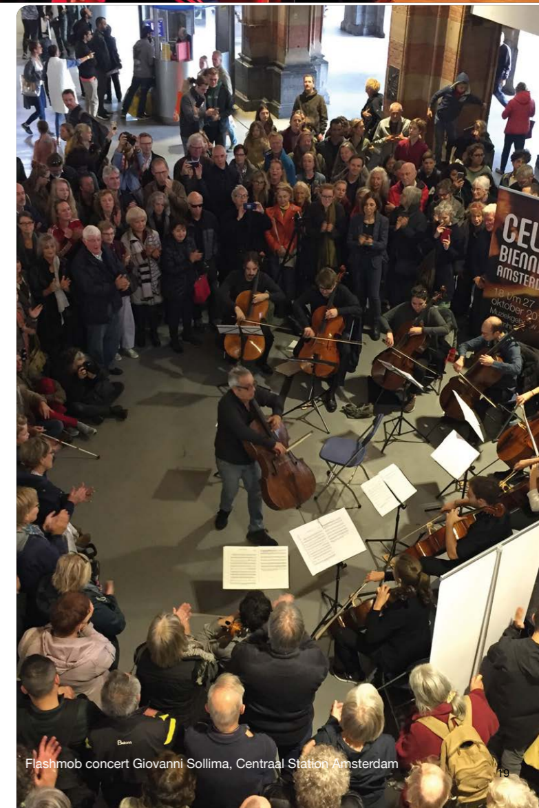
Flashmob concert Giovanni Sollima, Centraal Station Amsterdam

De Cello Biënnale wil toegankelijk zijn voor iedereen en financieel haalbaar voor elke portemonnee. Voor deze Biënnale werd hetzelfde prijspeil gehanteerd als in 2014 en 2016, de kaartprijzen zijn niet verhoogd. De kaartprijs lag tussen €7,50 en €39,50. Daarnaast was een groot aantal evenementen en concerten gratis toegankelijk.