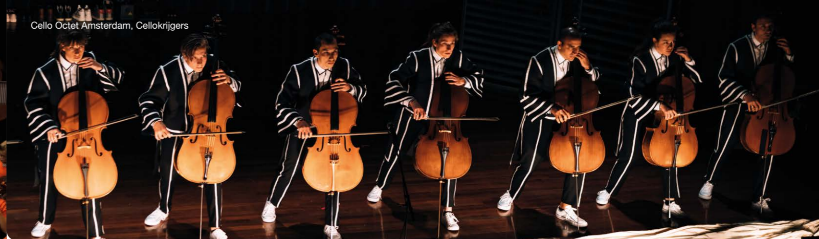
Cello Octet Amsterdam, Cellokrijgers