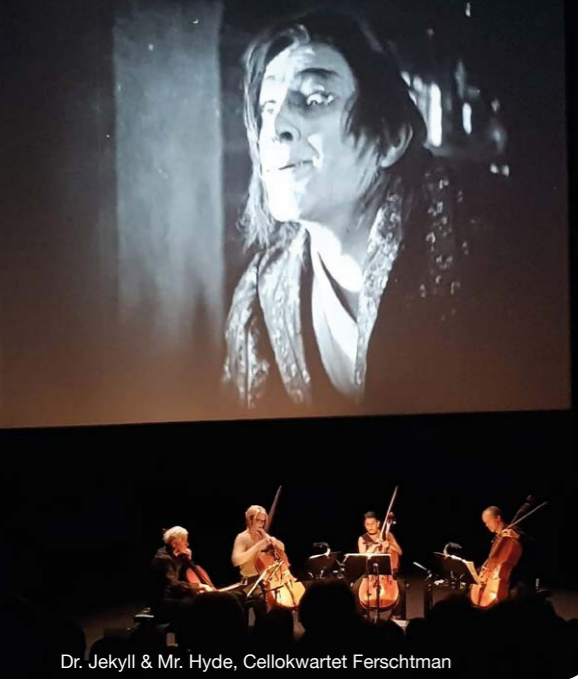
Dr. Jekyll & Mr. Hyde, Cellokwartet Ferschtman