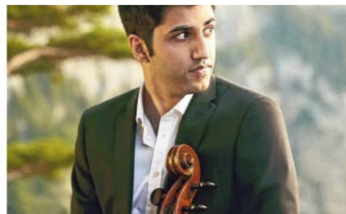
Kian Soltani (links) en Sheku Kanneh-Mason