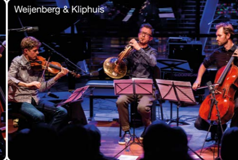
Weijenberg & Kliphuis