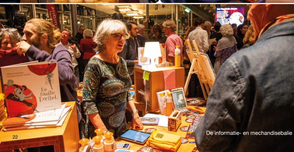
De informatie- en merchandisebalie