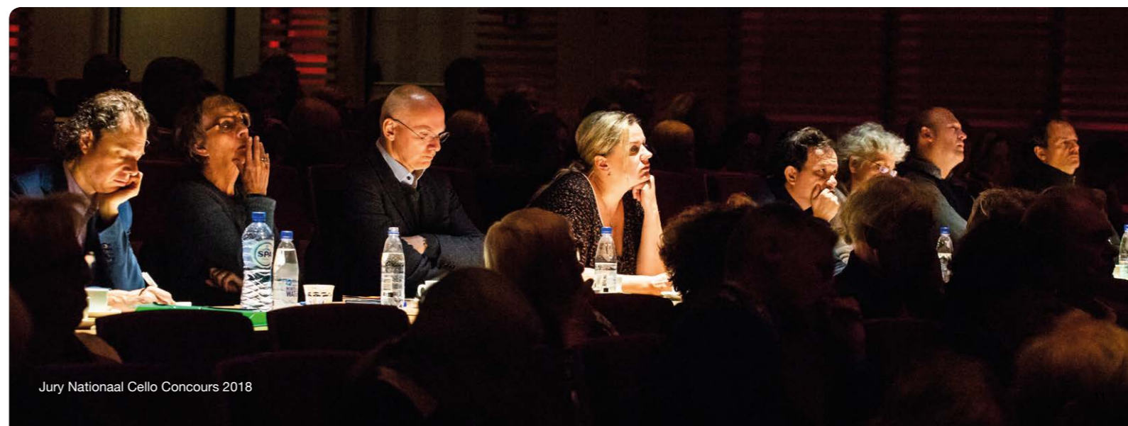
Jury Nationaal Cello Concours 2018

D'Addario stelt voor elke deelnemer van het Nationaal Cello Concours een set Kaplan snaren beschikbaar.