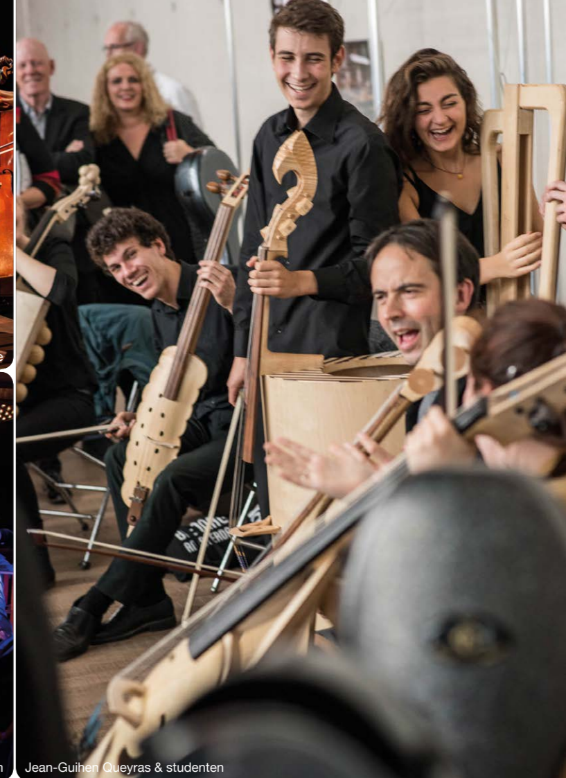
Jean-Guihen Queyras & studenten

De Cello Biënnale 2018 bood naast de reguliere concerten een uitgebreide randprogrammering met gratis toegankelijke evenementen.