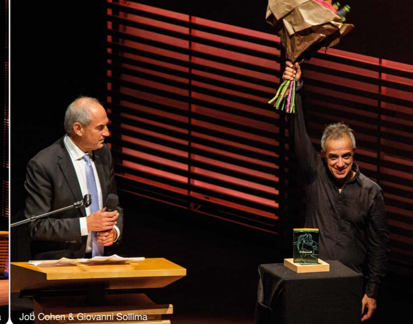
Job Cohen & Giovanni Sollima