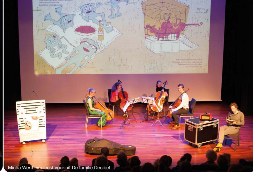
Micha Wertheim leest voor uit De familie Decibel